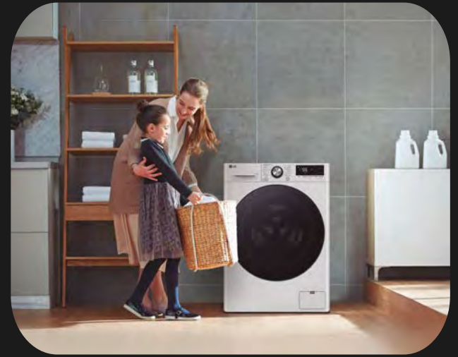
Resto de cocina LG