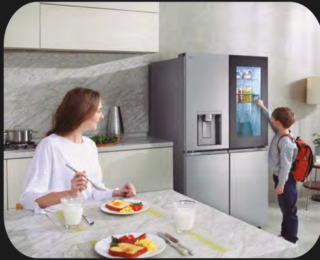
Frigoríficos y vinotecas