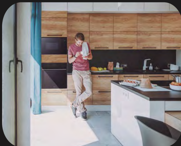
Hornos y microondas